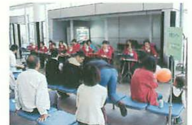
ロビーコンサート、踊りなどに

備品: 電子グランドピアノ1台、マイク4本、 アンプ付きスピーカー2台、CDラジカセ1台