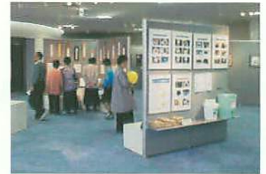
絵画、ポスター展示などに